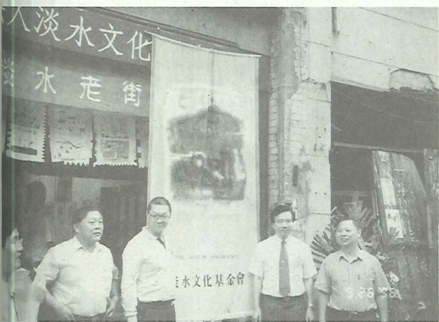
淡水五月節開幕式

今年元月，淡水文化基金會獲得縣立文化中心補助進行「淡水老街街區風土文化再生計畫」，此項計畫，其中一項重要的計畫內容為老街店家的口述歷史工作。幾個月來，老街店史記錄活動鼓舞居民的參與熱情，一段段精彩的動人的歷史記憶，透過受訪耆者的口述回憶重新再生，令人神往。