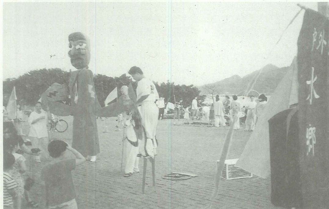
結合墨西哥神話及台灣環保議題的表演活動 <水鄉的傳說>

『水鄉的傳說』結合中南美洲的神話和臺灣環保運動的場景，是一齣沿著淡水河，穿過老城鎮，面對新建建築（捷運站），背襯觀音山及其水中倒影，在夕陽餘輝掩映中演出的戲碼，不論在演出地點及形式上，皆賦予淡水之人文與景觀的文化代表性。